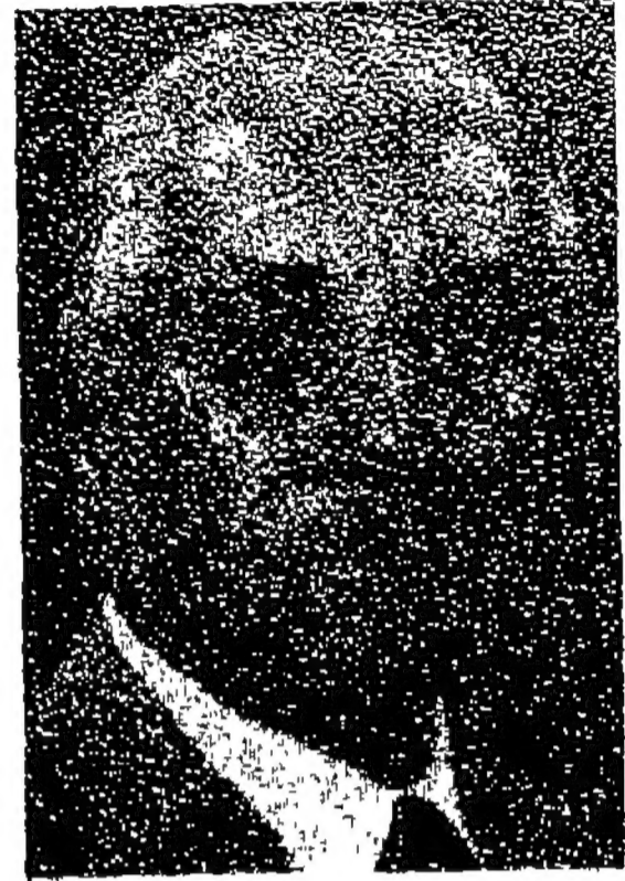
عبد الوهاب البياتي